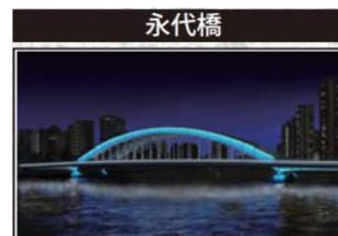
※ライトアップイメージ

■ 実施済みの施設 ⇒平成28年度末までに実施された施設を対象(イベント除く) ■ H32年度までに実施予定の施設