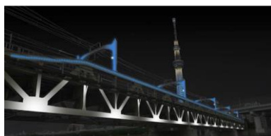
東武スカイツリーライン 隅田川橋梁ライトアップ事業

(平成29年度から、産業労働局が「建造物のライトアップモデル事業費補助金」を実施)