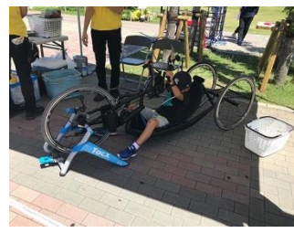
③自転車競技（ハンドサイクル）